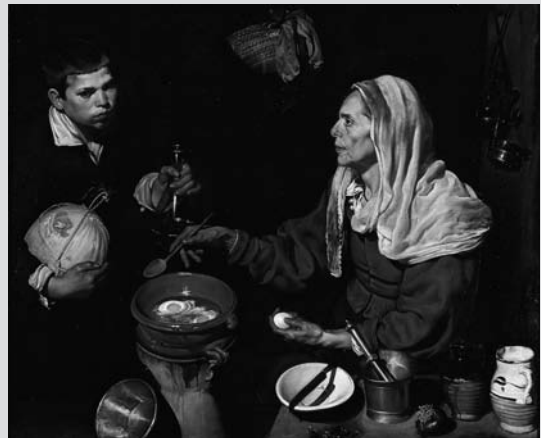
Imagen 2 A