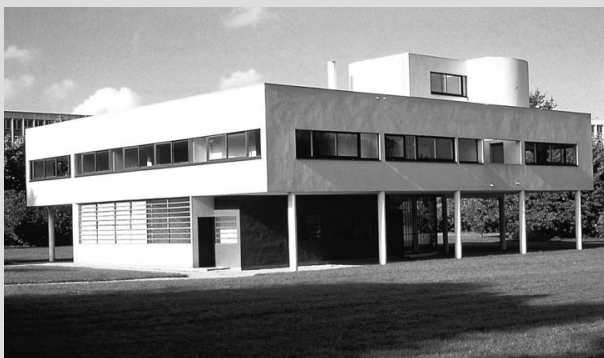
Imagen 1 B