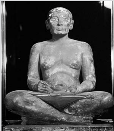
Imagen 1 A