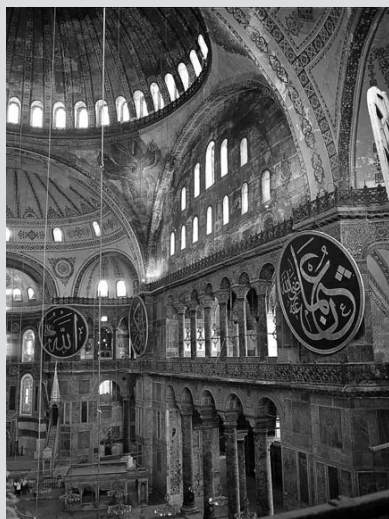
Imagen 1 B