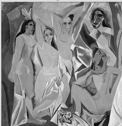
Imagen 1 A