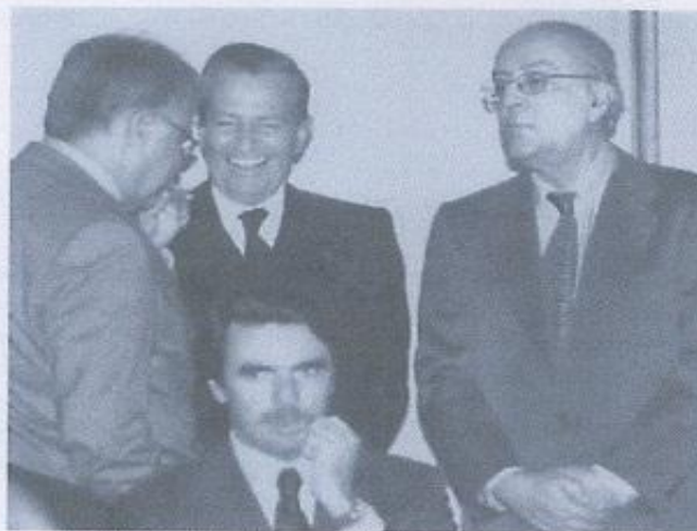
Presidentes del gobierno en la Monarquía de Juan Carlos